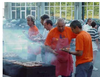
Très important : le barbecue !

autorités locales, la course leur doit beaucoup. Le comité d'organisation a la foi qui soulève les montagnes.